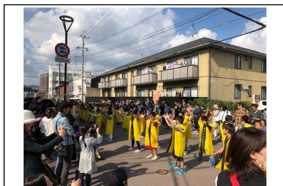
しんいづかぶらり市