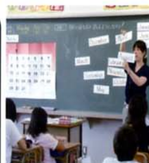
外国語活動での乗り入れ授業