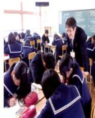
きめ細やかな指導