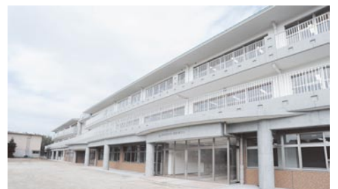
平成25年4月開校 穎田校(小1校)