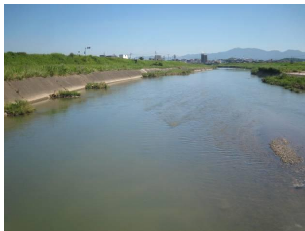
若菜橋地点の様子