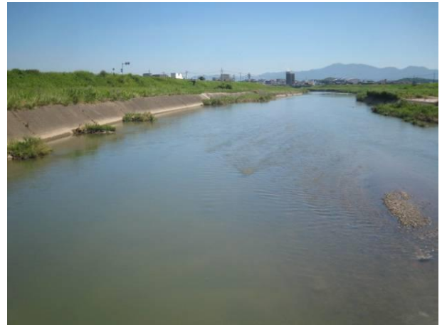
若菜橋地点の様子