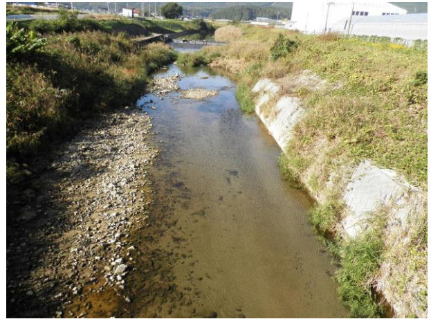
久保白橋地点の様子