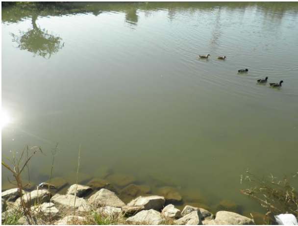
太郎丸樋管地点の様子