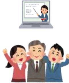
市民協働部 まちづくり推進課