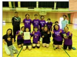
(上) 潤野上区自治会 (下) 東潤野自治会