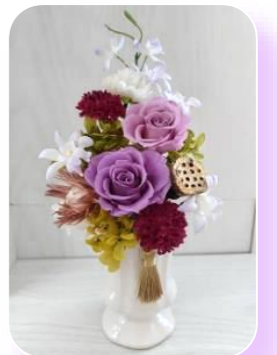
◎受付に見本を用意しています (高さ約26cm)

※お仏壇用に対(2個)も可能です その場合は、材料費5,000円、終了時間は12時までとなります ご希望の方は、窓口受付時にお申し出ください