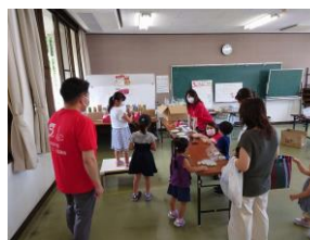
写真は昨年開催の様子です☆