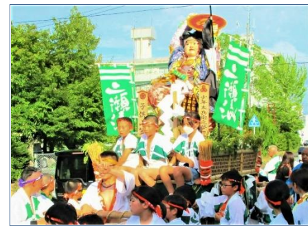
子ども山もがんばりました！

二瀬流 子ども山笠にご理解、ご協力いただきまして誠にありがとうございました。10日はあいにくの豪雨で中止となりましたが、12日の流れ昇ぎ、14日の山笠大会は大きな怪我なく二日間合計で約200人以上のお子様に参加してくださいました。来年も地域の皆様のご理解、ご協力の程、よろしく願いいたします。