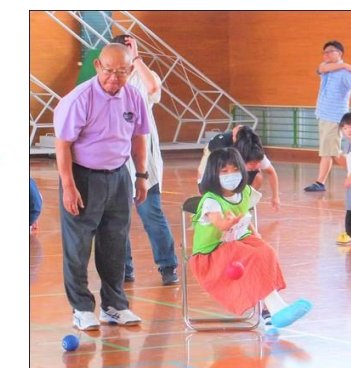
監督も応援!! ガンバレ!!