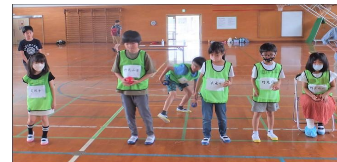
みんなで力を合わせてがんばるぞー!

6月25日(日)伊岐須小学校体育館において第14回子ども球技大会・ポッチャ大会が開催されました。二瀬地区より東横田子ども会が出場し、見事なチームワークで、第三位の成績を収められました。