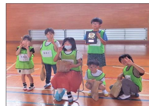
第三位 笑顔でピースサイン!