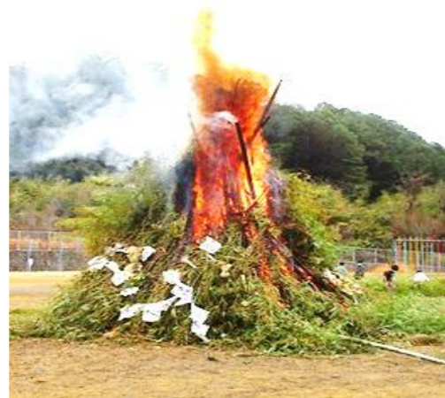
今年のどんど焼きの様子