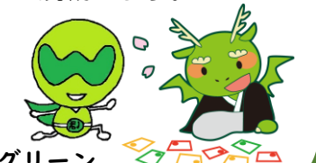
わか なっちグリーン