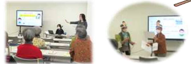
12月 暮らしの出前講座の様子