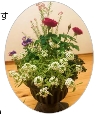
※花の種類は写真と異なる場合があります