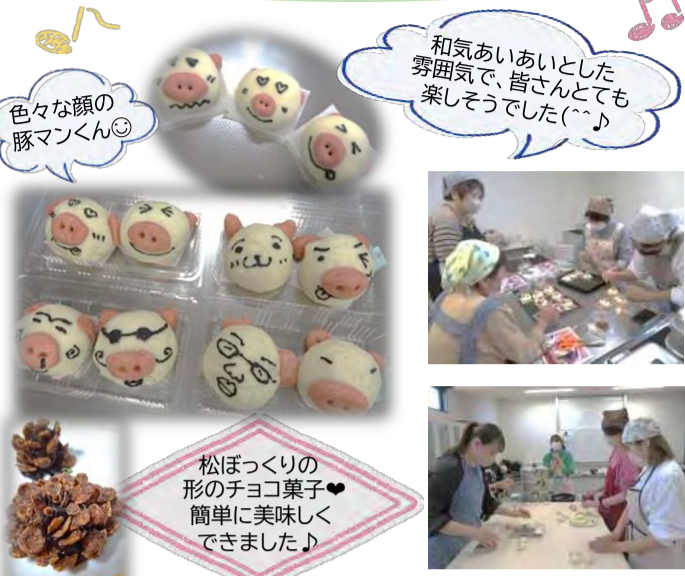
色々な顔の豚マンくん